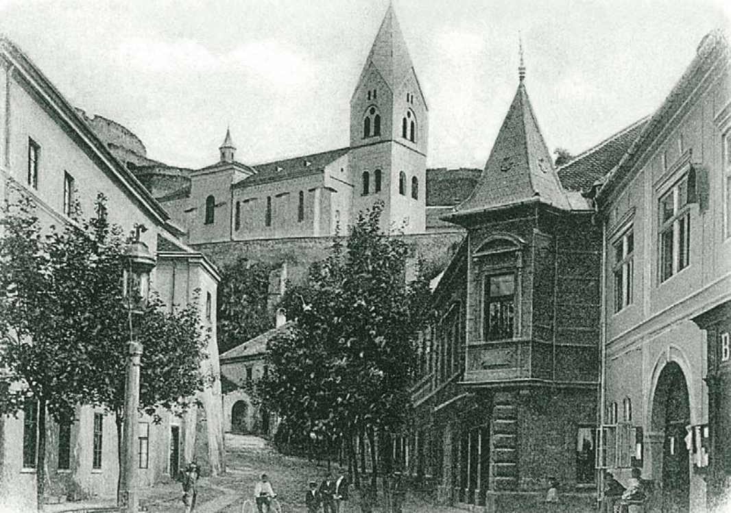
MAX STERN A TRENČÍN