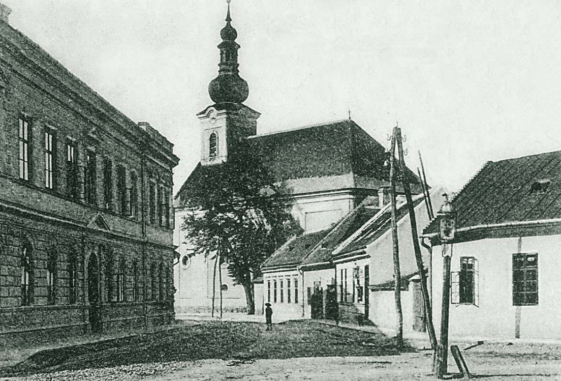
MAX STERN A TRENČÍN