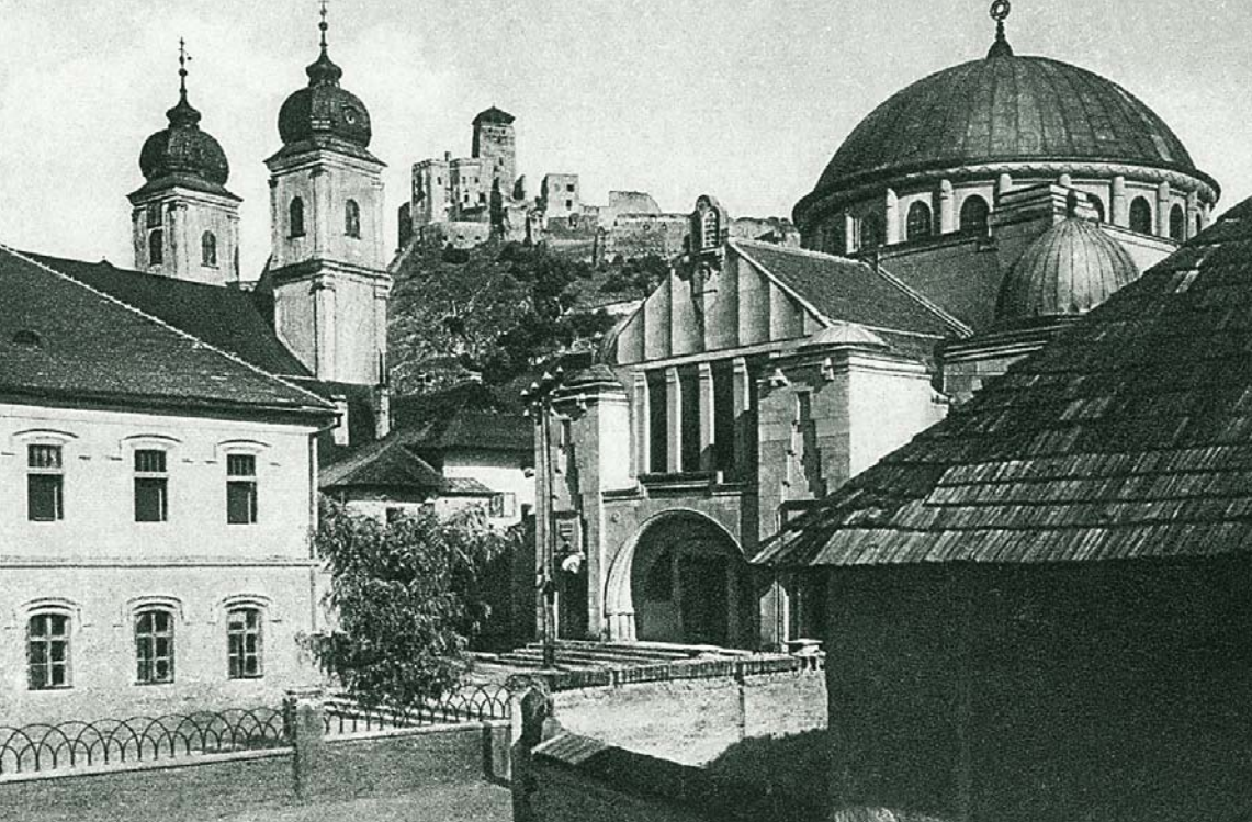
MAX STERN A TREŇČÍN