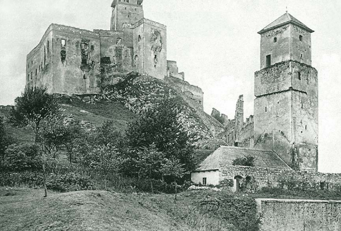
MAX STERN A TRENCÍN