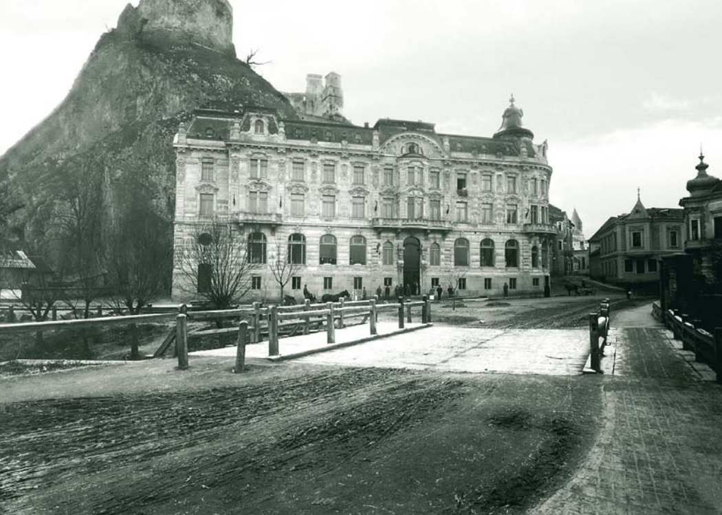
MAX STERN A TRENČÍN