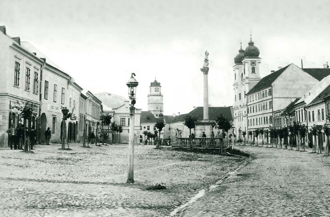
MAX STERN A TRENČÍN