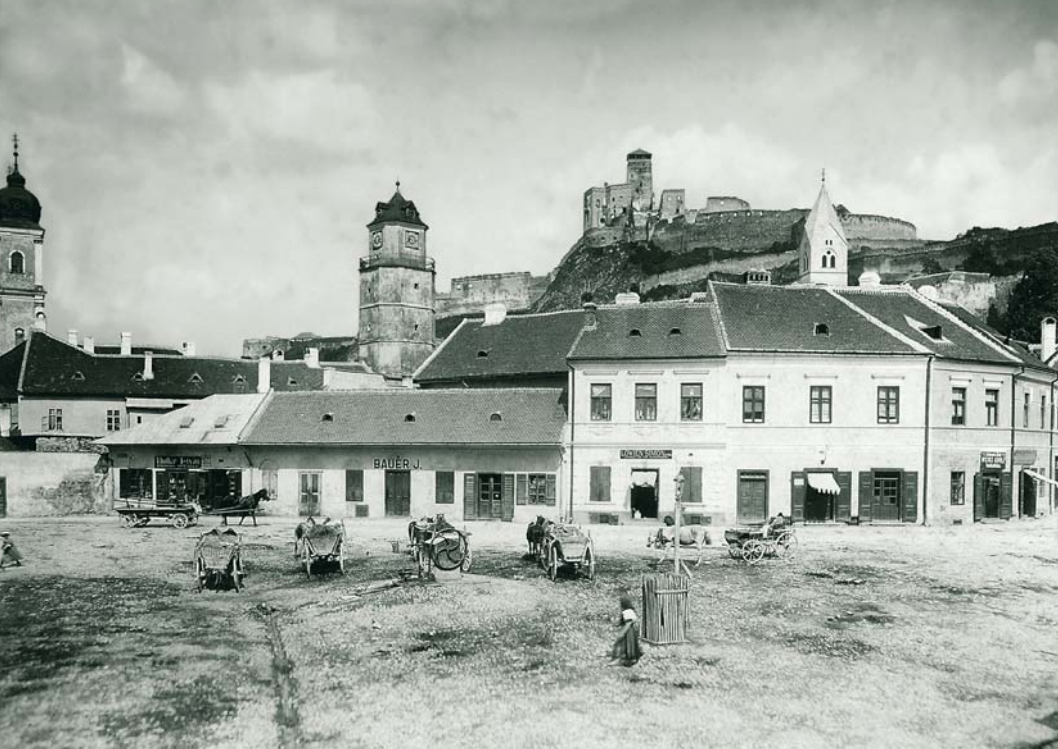
MAX STERN A TREŇCÍN