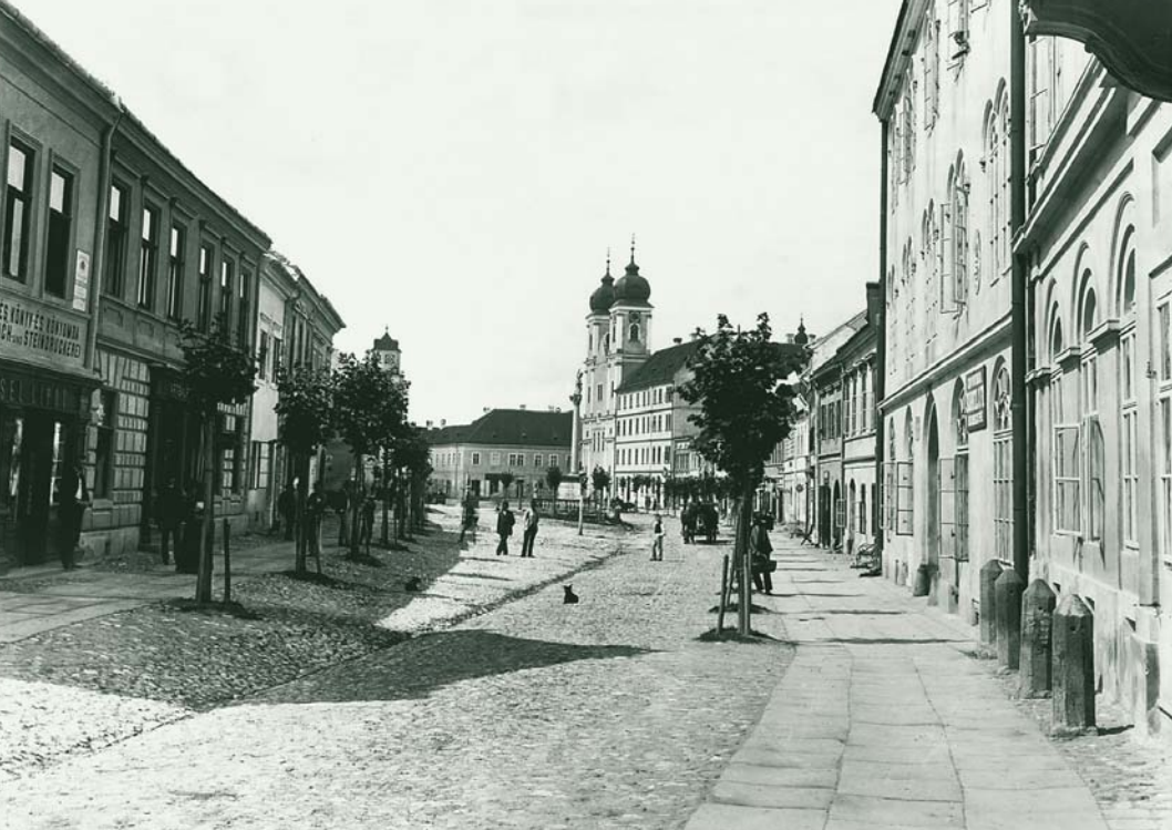
MAX STERN A TREŇČÍN