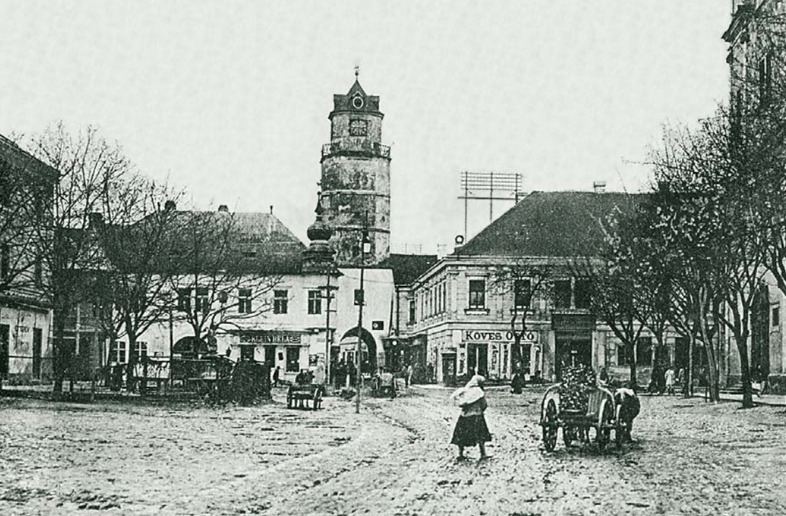
MAX STERN A TRENCÍN