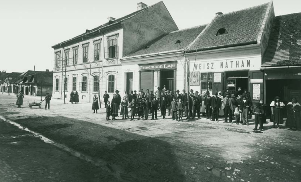
MAX STERN A TRENČÍN