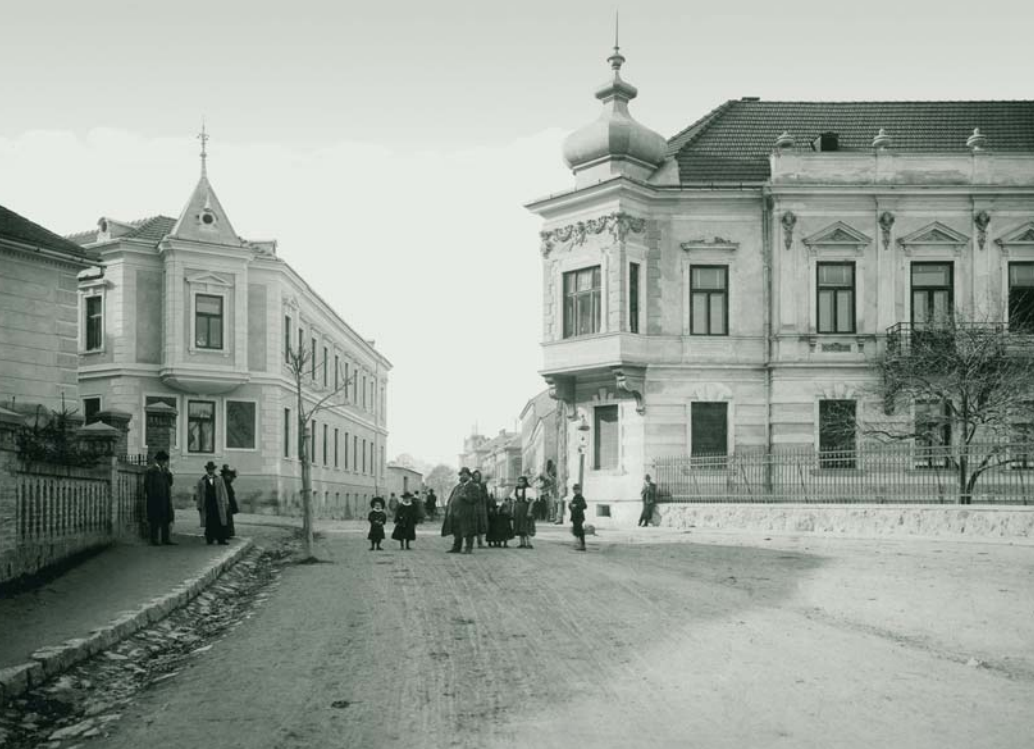
MAX STERN A TRENČÍN